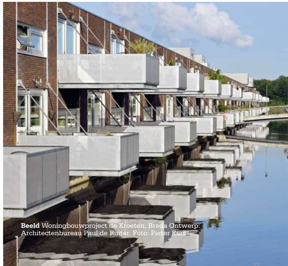
Beeld Woningbouwproject de Kroeten, Breda Ontwerp: Architectenbureau Paul de Ruiter.