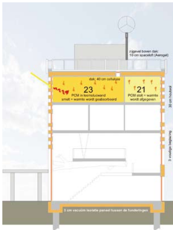
Beeld Schematische weergave van de Isolatie /kierdichting/wamteaccumulatie (PCM) van Steigereiland 2.0. Rondom de woningen is een hoogwaardig isolerende schil getrokken (gemiddeld RC = 10,0 W/m 2 K), er zijn geen koudebruggen of luchtlekken.

energie gebruiken. Senioren hebben het bijvoorbeeld eerder koud en zetten de verwarming hoger. Met dergelijke woonstijlen wordt echter geen rekening gehouden.'