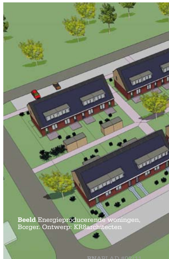
Beeld Energieproducerende woningen, Borger. Ontwerp: KR8architecten